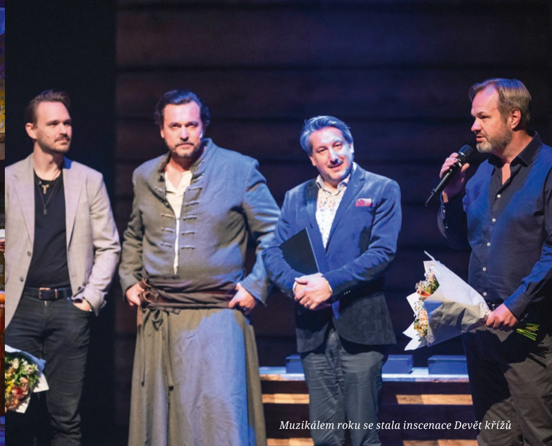
Muzikálem roku se stala inscenace Devět křížů