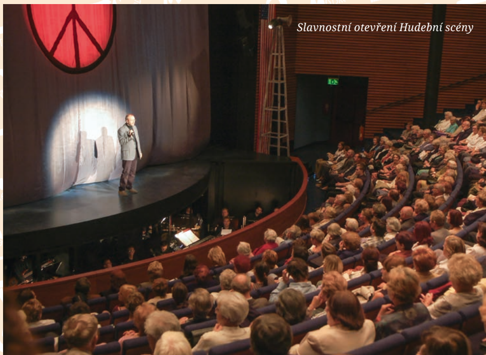
Slavnostní otevření Hudební scény

Hlasujte v divácké anketě Křídla a oceňte výkony těch, kteří si to podle Vás zaslouží nejvíce!