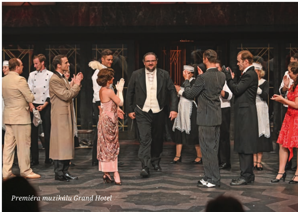
Premiéra muzikálu Grand Hotel

zartovy árie. A mluvili jste o Bitls , že by to mohlo být na podobném principu. Jenže když si to srovnáš s Bitls – to byly obecně, notoricky známé věci, jedna vedle druhé. Co znají masy z Mozarta?